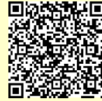
「ラーケーションの日」ポータルサイト

※ 県の Web ページ「ラーケーションの日」ポータルサイトには、計画づくりに活用できる「ラーケーションカード」や、いろいろな学びができる場所を紹介しています。参考にしてください。