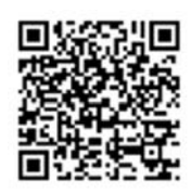
「ラーケーションの日」活動事例集