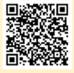
「ラーケーションの日」活動事例集